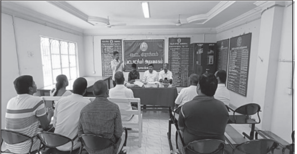
நாமக்கல் மாவட்டம், தமிழ்நாடு வருவாய்த்துறை அலுவலர் சங்கத்தின் மாவட்ட செயற்குழு கூட்டம்