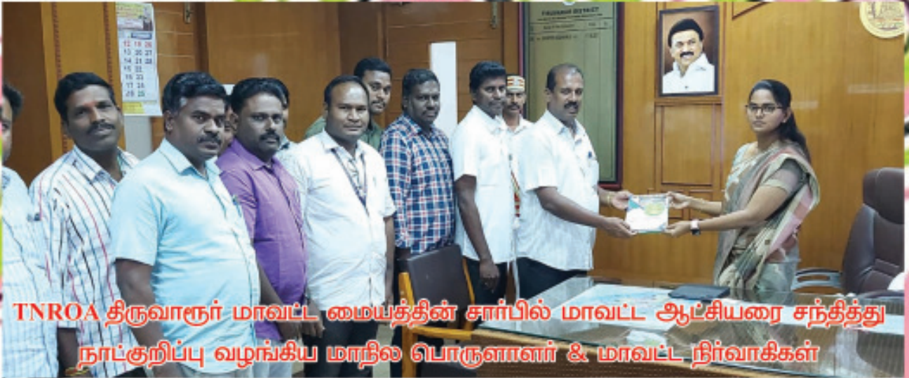
TNROA திருவாரூர் மாவட்ட மையத்தின் சார்பில் மாவட்ட ஆட்சியரை சந்தித்து நாட்குறிப்பு வழங்கிய மாநில பொருளாளர் & மாவட்ட நிர்வாகிகள்