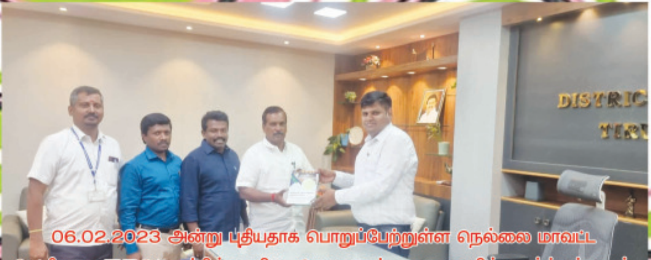
06.02.2023 அன்று புதியதாக பொறுப்பேற்றுள்ள நெல்லை மாவட்ட ஆட்சியரை TNROA சார்பில் மாநில செயலாளர் தலைமையில் வாழ்த்துக்களும், வரவேற்பும், நாட்காட்டி மற்றும் புத்தகமும் வழங்கப்பட்டது