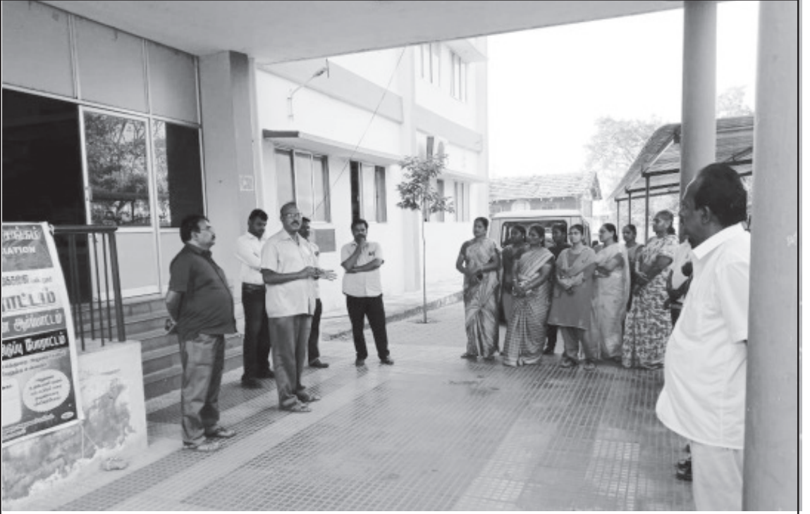
திண்டுக்கல் மாவட்டம் பழனி வட்டத்தில் நடைபெற்ற வெளிநடப்பு ஆர்ப்பாட்டத்தில் மாநிலத் துணைத்தலைவர் இரா.மங்களபாண்டியன் ஆர்ப்பாட்ட உரை