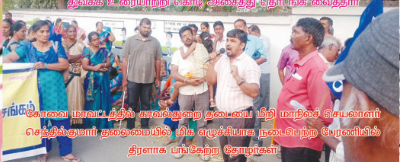
கோவை மாவட்டத்தில் காவல்துறை தடையை மீறி மாநிலச் செயலாளர் செந்தில்குமார் தலைமையில் மிக எழுச்சியாக நடைபெற்ற பேரணியில் திரளாக பங்கேற்ற தோழர்கள்