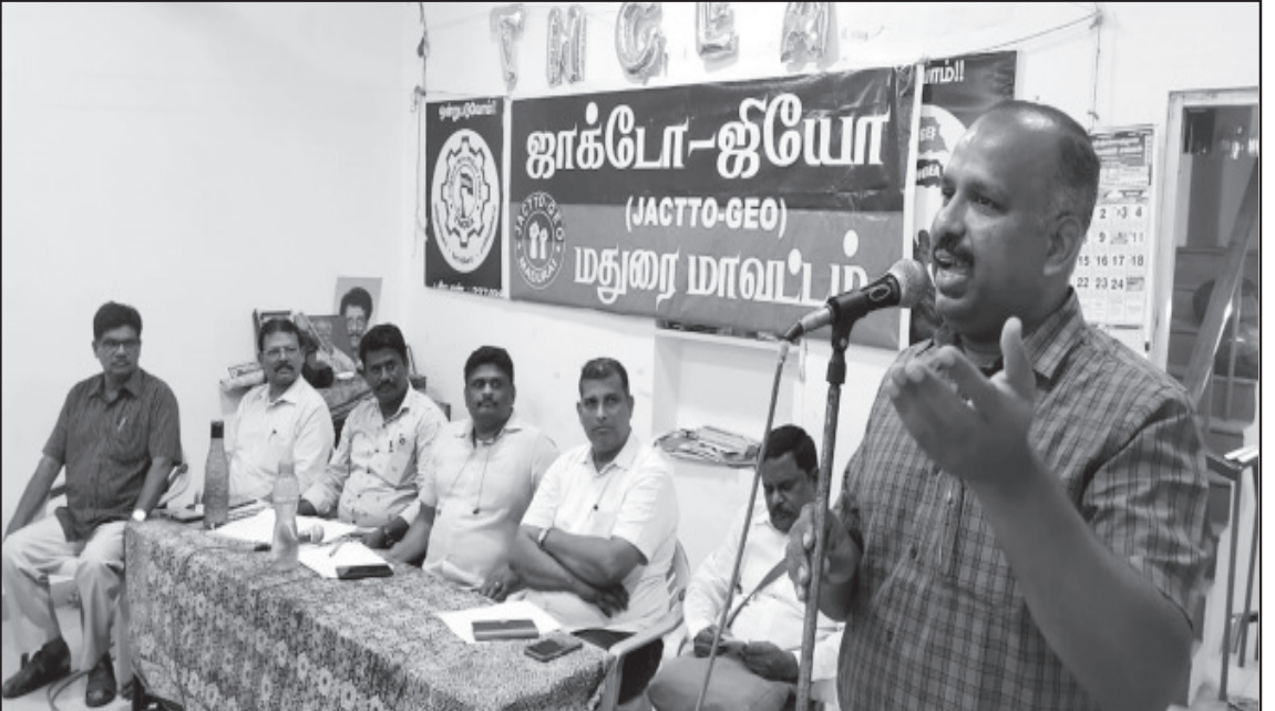
3.2.23 அன்று மதுரை மாவட்ட ஜாக்போ ஜியோ கூட்டத்தில் கலந்து கொண்டு, எதிர்வரும் இயக்கங்களை எழுச்சியாக நடத்த வேண்டிய அவசியம் குறித்து எடுத்துரைக்கப்பட்டது.